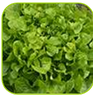
Feuille de chêne