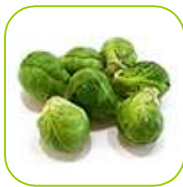
Chou de Bruxelles