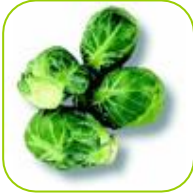
Chou de Bruxelles