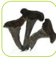
Trompette de la mort