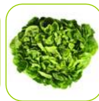
Feuille de chêne