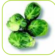
Chou de Bruxelles