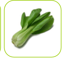
Chou Pak Choi