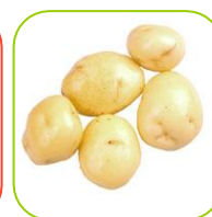
Pomme de terre