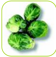
Chou de Bruxelles