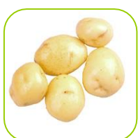
Pomme de terre