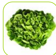
Feuille de chêne