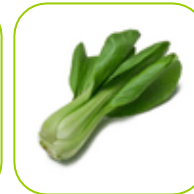
Chou Pak Choi