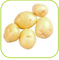
Pomme de terre